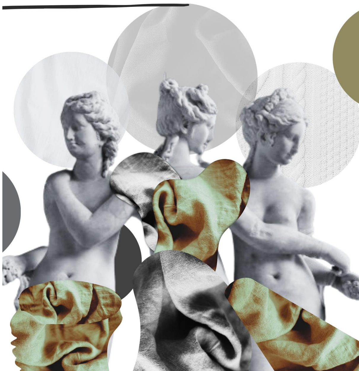
1. Terezija Tomić (1. stranica)